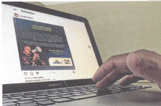
Unicectma lançou nota de alerta em municípios para cobrir novas ações criminosas desta natureza

Ainda segundo ele, os conselheiros tutelares estão preocupados com as crianças e os adolescentes, e estão emitindo "Nota de Alerta" para que os pais e a sociedade fiquem atentos e evitem um possível sequestro. "Os conselheiros pedem que os pais e responsáveis por crianças e adolescentes não os deixem